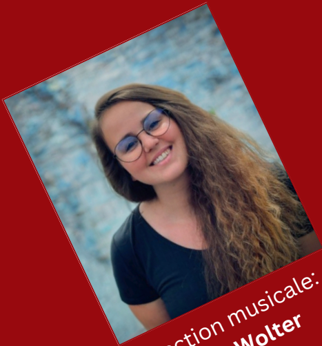
Direction musicale: Sarah Wolter