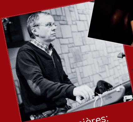
Lumières: Michel Binamé