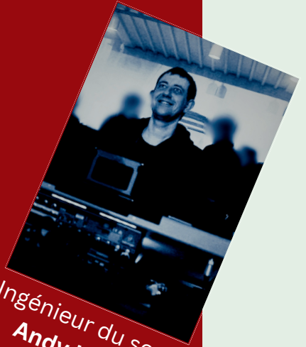
Ingénieur du son: Andy Lauer